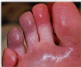
Wintertenen, met name de derde en vierde teen

Wintervoeten of wintertenen ontstaan door te lange blootstelling aan kou, waardoor er een verstoring ontstaat van de bloedsomloop in de huid. De ene persoon is gevoeliger voor het opdoen van wintervoeten dan de ander. Wintervoeten of tenen kunnen ook veroorzaakt worden door een slechte doorbloeding van de haarvaatjes van de huid. Wintervoeten worden gekenmerkt door rode, gezwollen plekken. Bij kou zijn deze erg pijnlijk. Bij warmte treedt jeuk op. Verder kunnen in ernstige gevallen ontsteking, blaren, kloven en zweren voorkomen.